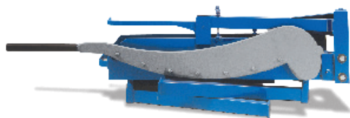
BSS 1000 ze składaną podstawą